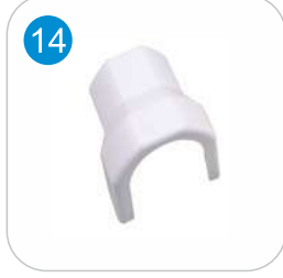
PVC SAYAÇ BİRLEŞTİRME KAPAĞI