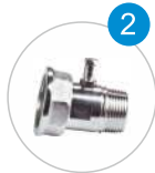
SELENOİD VANA VE SAYAÇ REKOR-PRİNÇ