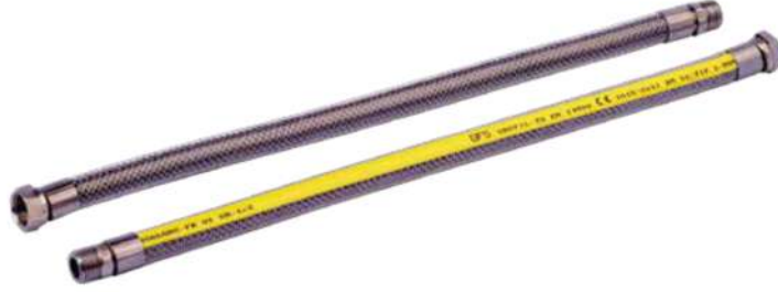
24 EN 14800 GAZ FLEXİ