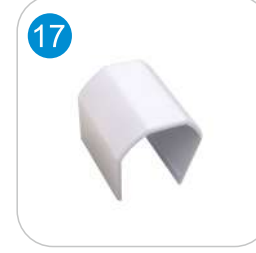
PVC KANAL EK PARÇA