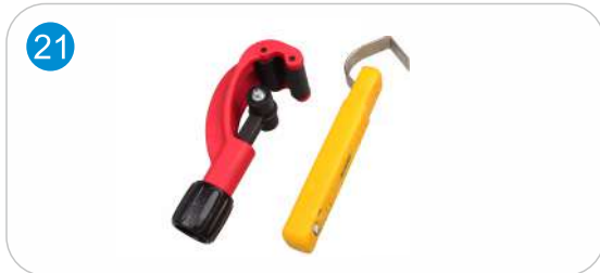
ÖZEL BORU KESİCİSİ VE PVC KAPLAMA SİYİRCİ