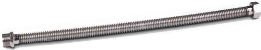
33 SU FLEXİ