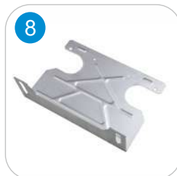
GFS TESİSAT KONSOLU