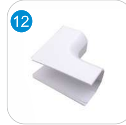
PVC İÇ KÖŞE