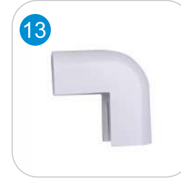
PVC DIŞ KÖŞE