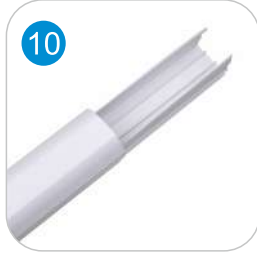
PVC BORU KANALI