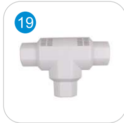
PVC ( T ) KAPAMA