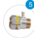
TEST NİPELLİ ERKEK REDÜKSİYON