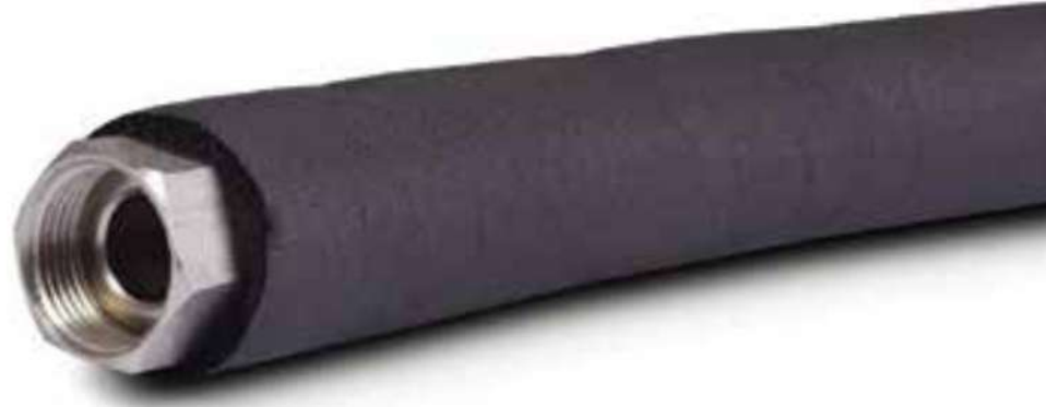
32 FAN-COİL FLEXİ