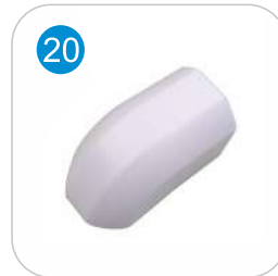
PVC DUVAR BİTİŞ