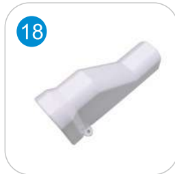
PVC SAYAÇ KAPAMA