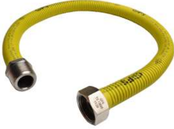
26 PASLANMAZ KOMBİ FLEXİ 13890