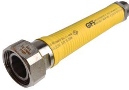
28 SAYAÇ FLEXİ 13890