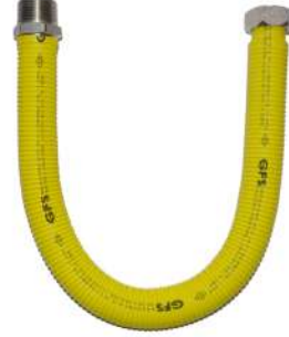
27 1" - 1" KOMBİ FLEX 13890