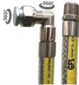
25 EN 14800 DÖNER DİRSEKLİ GAZ FLEXİ