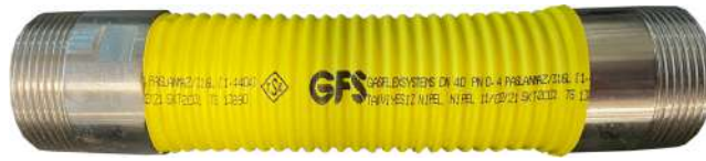
29 BRÜLÖR FLEXİ 13890