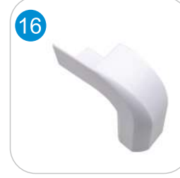
PVC TERS KÖŞE