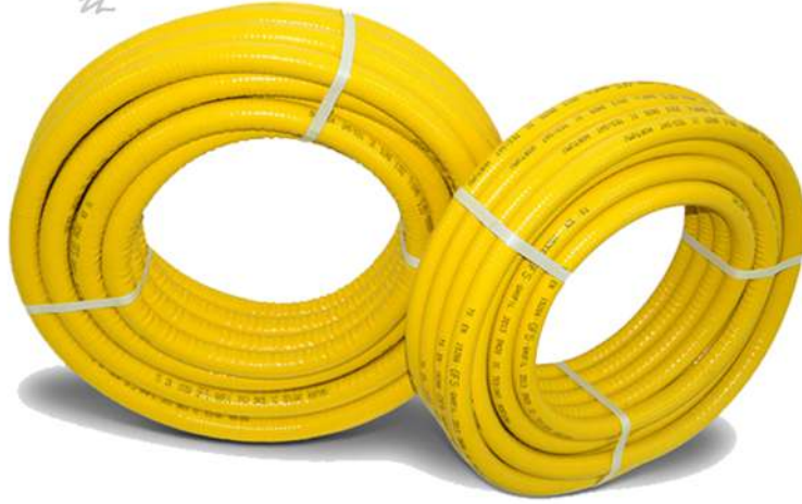
1 TS EN 15266 Gaz Flexi