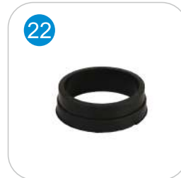
ISIYA DAYANIKLI SIZDIRMAZLIK CONTASI